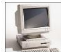
Ecrans de PC