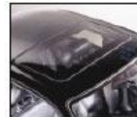
Toits ouvrants de voiture

ADLER SA 9, avenue des 22 arpents – ZA la Barogne – 77230 MOUSSY LE NEUF Tel. : 01 60.03.62.00 – Fax : 01.60.03.62.49 – email : admin1@adler-sa.com Internet : www.adler-sa.fr